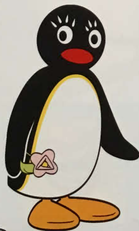
Pingi är Pingu's flickvän.