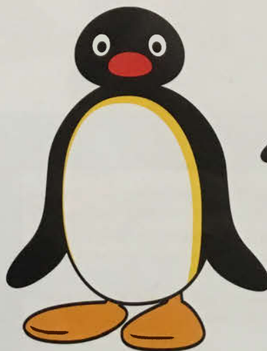
Pingu är en liten busig pingvin som älskar att leka med sina kompisar.