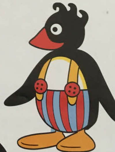
Punky är en gammal kompis till Pingu och den enda pingvinen som har kläder.